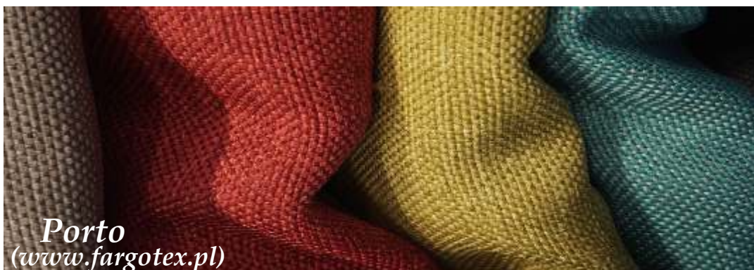
Porto ( www.fargotex.pl )