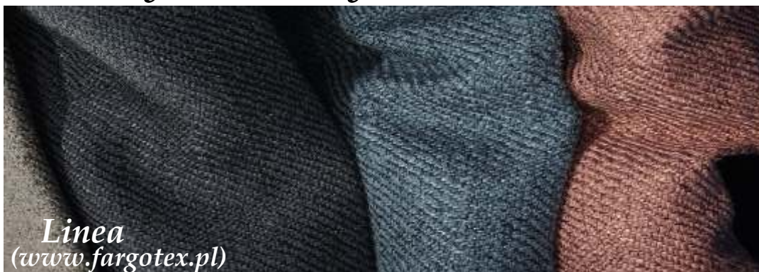
Linea ( www.fargotex.pl )