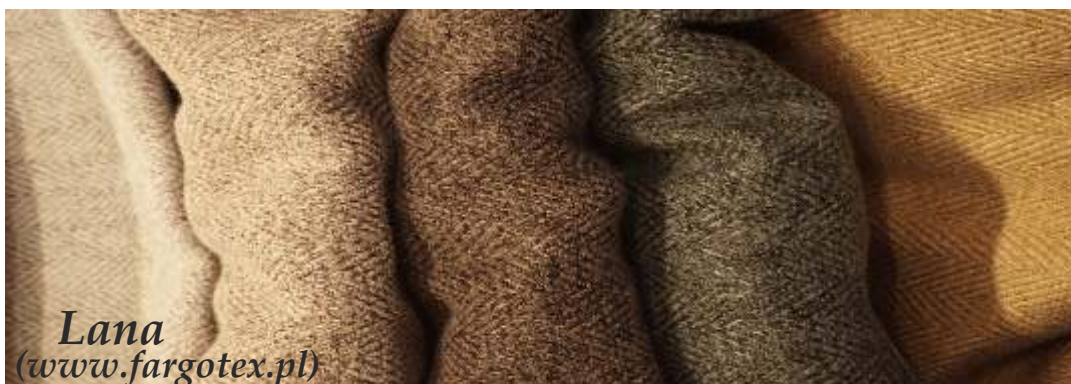
Lana ( www.fargotex.pl )